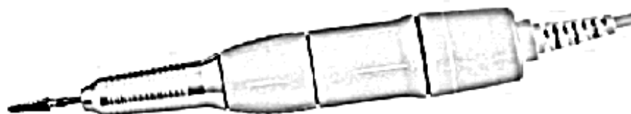
Bruska Promed 2520 Návod k použití